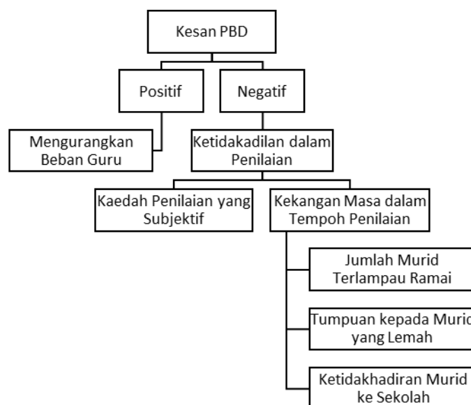
Rajah4 Kesan Pengaplikasian Kaedah PBD Tahap Satu