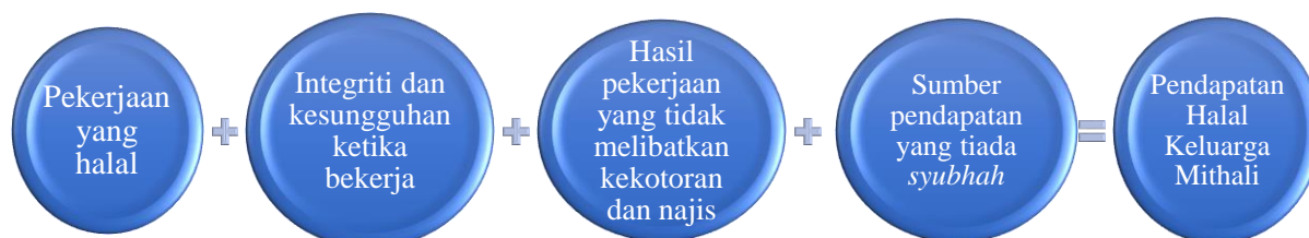
Rajah 2 Konsep Pendapatan Halal Keluarga Mithali (KPNHKM)

Hasil daripada dapatan dan perbincangan di atas, pendekatan bersifat deduktif dan ambilan secara kolektif membolehkan kajian ini membina sebuah model yang dilabel sebagai Konsep Pendapatan Halal Keluarga Mithali (KPNHKM) seperti yang dipaparkan dalam rajah 2 di bawah: